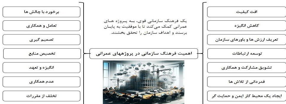
شکل ۱: کلیاتی از تأثیرات فرهنگ سازمانی قوی و ضعیف در پروژه‌های عمرانی

فرهنگ سازمانی به‌عنوان یکی از مؤلفه‌های کلیدی در عملکرد سازمان‌ها، می‌تواند نقش بسزایی در تقویت یا تضعیف میزان یادگیری و نوآوری در پروژه‌های عمرانی ایفا کند. این مفهوم که شامل مجموعه‌ای از ارزش‌ها، باورها، رفتارها و هنجارهای مشترک در یک سازمان است، قادر است محیطی فراهم کند که اعضای گروه بتوانند با بهره‌گیری از تفکر خلاقانه و تبادل دانش، راه‌حل‌های جدید و کارآمدی برای چالش‌های پیش‌رو ایجاد کنند. از سوی دیگر، اگر فرهنگ سازمانی منقطع نباشد یا از نوآوری حمایت نکند، ممکن است منابع سازمانی هدر روند و پیشرفت پروژه‌ها با موانع جدی مواجه شود؛ بنابراین، توجه به توسعه یک فرهنگ سازمانی قوی که یادگیری و نوآوری را تشویق کند، برای موفقیت در اجرای پروژه‌های عمرانی ضروری است [۳۶]. شکل (۱)