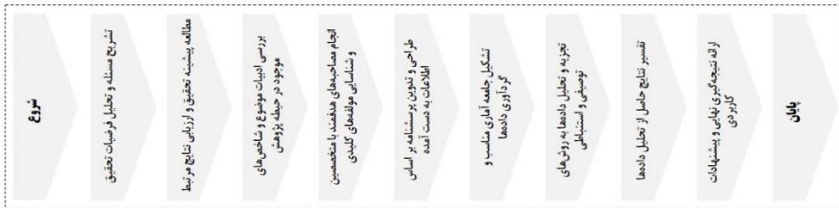
شکل ۳: مراحل انجام پژوهش

ضریب آلفای کرونباخ در این مرحله، مقدار ۰,۸۶۶ به دست آمد که حکایت از سطح پایایی مناسب پرسشنامه داشت. در نهایت، داده‌های جمع‌آوری شده به وسیله نرم‌افزار SPSS تحلیل شدند. این تحلیل شامل دو روش آماری بود؛ ابتدا با استفاده از آمار توصیفی به شناسایی ویژگی‌های اولیه داده‌ها پرداخته شد و سپس با بهره‌گیری از آمار استنباطی، بینش‌های عمیق‌تری ارائه گردید. جزئیات مراحل انجام پژوهش نیز در شکل (۳) نمایش داده شده است.