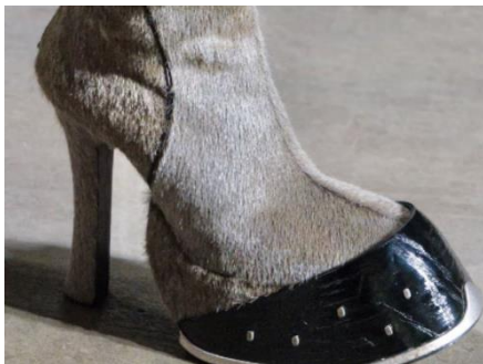
تصویر ۲- طراحی کفش با ایده از سم اسب؛ آشنایی‌زدایی از قوانین و مبانی هنری.