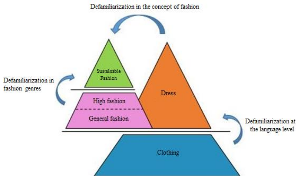
Figure 1: Levels of defamiliarization in Clothing, Dress, and Fashion