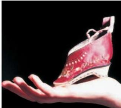
تصویر ۴. عدم توجه به حقوق زنان در مُد، مأخذ [۸۷]

گوارشی، مشکلات زنان و زایمان و ضعف در سیستم گردش خون را در پی داشت. باوجود این که موارد بی‌شماری از خسارت‌های بدنی مُد گزارش شده و می‌شود، گرایش به مُدهای جذاب و اغواکننده، فراگیر و رو به گسترش است. این موضوع حاکی از این حقیقت است که مصرف مُد، همواره رفتاری «عادی» قلمداد شده؛ تا حدی که نه تنها آسیب‌های غیرقابل‌جبران آن مورد اغماض قرار گرفته، بلکه خود زنان نیز در تبعیت از مُد، به‌صورت ناخودآگاه تعصب‌دارند. «کوکو شنل» ۳۱ در قرن بیستم، مفهوم راحتی را به نظام مُد وارد کرد و اکنون مُد پایدار از خشک‌اندیشی‌های مرسوم در مُد، آشنایی‌زدایی می‌کند. به این معنا که زن و مرد در تمام نژادها و فرهنگ‌ها از حقوق برابر برخوردارند و راحتی، بهداشت و سلامت همگان از اصول بنیادین مُد پایدار است.