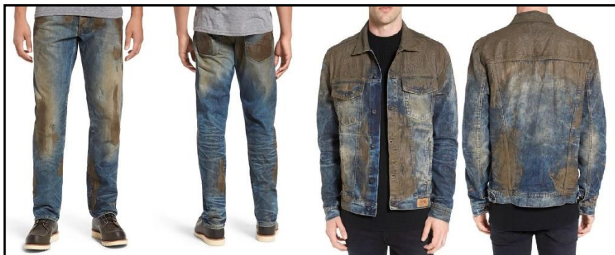
تصویر ۳. آشنایی‌زدایی در جهت رواج مُد، مأخذ:

مُد طبقات پایین جامعه تبعیت می‌کنند و سبک‌های جدید و نمادهای طبقاتی، رواج رو به بالا دارند» [۱۷۵]. برای مثال؛ لباس‌های جین که در اصل به دلیل ایمنی و راحتی، به‌عنوان لباس کار تهیه می‌شدند بعدها در سیستم مُد وارد شدند و حتی افکت‌های پارگی و رنگ‌رفتگی با هزینه گزاف بر روی آن‌ها اعمال شد. در رواج روبه پایین، لباس به این دلیل استفاده می‌شد که نشان دهد پوشنده آن ثروتمند است و جزء طبقه کارگر نیست تا نیاز به کار یدی داشته باشد؛ اما در مُد رو به بالا از مفهوم مُد به‌عنوان کالای لوکس و فاخر آشنایی‌زدایی شده و نگاهی زیبایی‌شناسانه به مفهوم فقر شکل می‌گیرد.