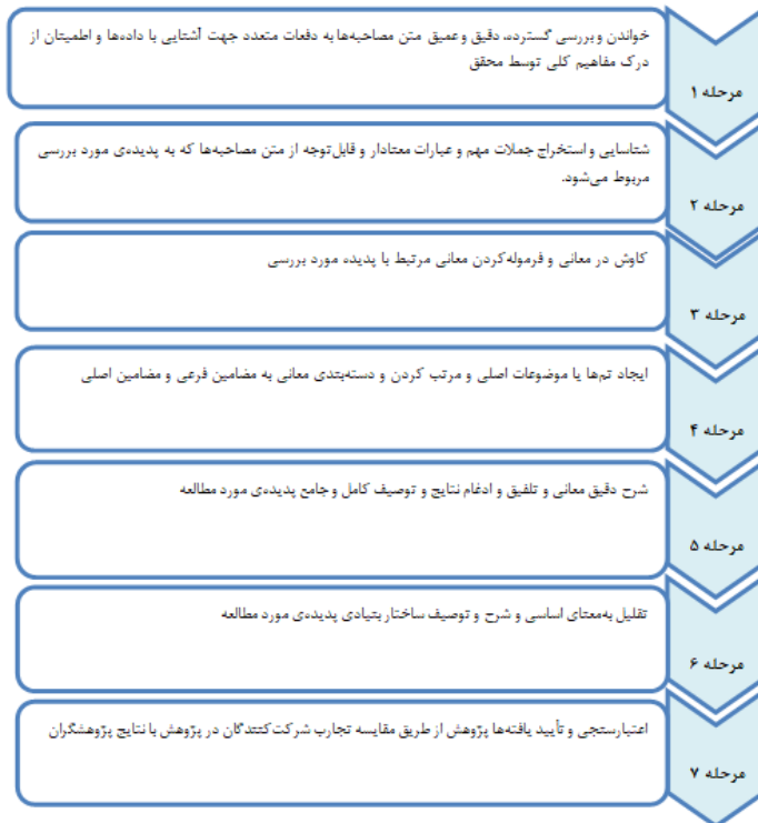
شکل ۱. فرایند روش پدیدارشناسی توصیفی در تحلیل داده‌های کیفی (کلایزی، ۱۹۷۸).

برای رعایت ویژگی‌های کیفی پژوهش از سه ملاک (لینکلن و گوبا، ۱۹۸۸) ۱ شامل قابل قبول بودن ۲ ، تأییدپذیری ۳ و قابلیت اطمینان ۴ استفاده شد. در مورد قابل قبول بودن و تأیید صحت یافته‌ها، رونوشت گزارش پژوهش برای مشارکت کنندگان در پژوهش ارسال و موافقت آنها با مطالب ذکر شده و یافته‌های پژوهش حاصل شد. به منظور تضمین قابلیت اطمینان یافته‌ها نیز سعی شد تا فرایندها و تصمیم‌های مربوط به پژوهش به طور مستند و واضح در متن پژوهش تشریح شود. در پایان، در راستای تضمین تأییدپذیری یافته‌های پژوهش، یافته‌ها با پیشینه پژوهش مقایسه و با استناد به بحث‌های نظری در تبیین آنها اقدام شد.