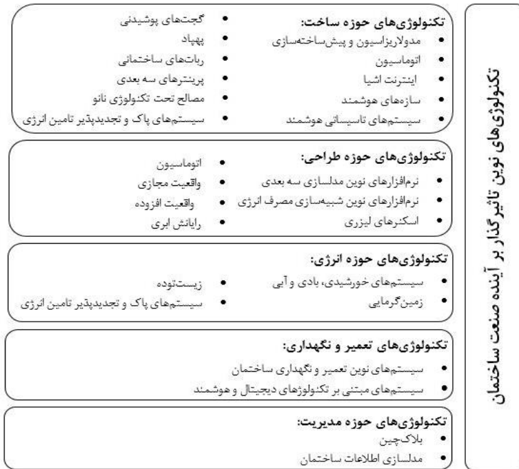
شکل ۱. معیارهای تکنولوژیک تأثیرگذار بر صنعت ساختمان.