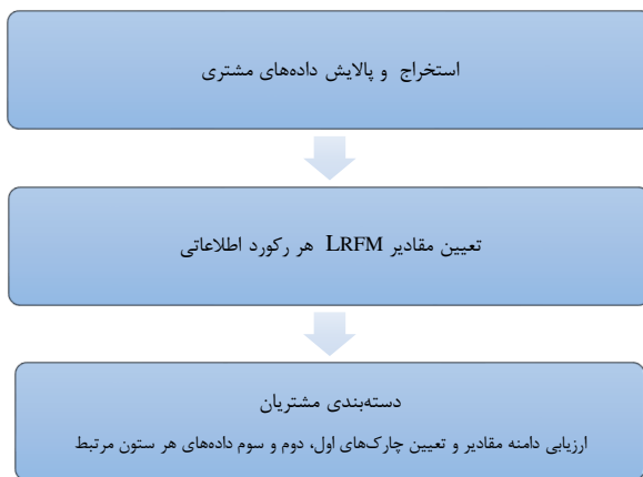
شکل ۱. نمودار کلی روش پیشنهادی برای دسته‌بندی مشتریان.

براساس شکل ۱، در ابتدا داده‌های مشتریان استخراج می‌گردد. این داده‌ها در هر مجموعه (و حتی در زیرمجموعه‌های یک مجموعه) می‌تواند ساختار متفاوتی داشته باشد. بنابراین استخراج و پالایش این داده‌ها به عنوان اولین گام روش پیشنهادی در نظر گرفته شده است. منظور از پالایش داده‌های مشتریان، اصلاح و یا در صورت ضرورت، حذف مقادیر ناخواسته یا تهی ارائه‌شده توسط مشتریان می‌باشد. وجود این مقادیر تأثیرات نامطلوبی بر کیفیت نتایج نهایی تجزیه و تحلیل داده‌ها می‌گذارد. مجموعه کاملی از روش‌های ممکن برای این پالایش در [۷] ارائه شده است. انتخاب ترکیب روش‌های مختلف وابستگی کاملی به مجموعه داده‌های در دسترس دارد و نمی‌توان یک الگوی یکسان را برای تمامی موارد اعمال کرد.