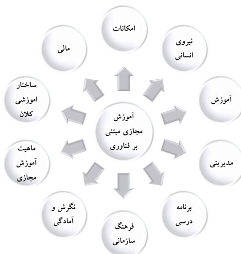
شکل ۱. مدل آموزش مجازی مبتنی بر فناوری در راستای پیش‌برد برنامه‌های آموزشی مدارس ابتدایی.

کدهای محوری پژوهش حاضر درواقع همان مقولات مستخرج شده در مرحله کدگذاری باز می‌باشند (کرسول، ۲۰۰۷) ۱ ؛ بنابراین مدل پژوهش در شکل ۱ نشان داده‌شده است: