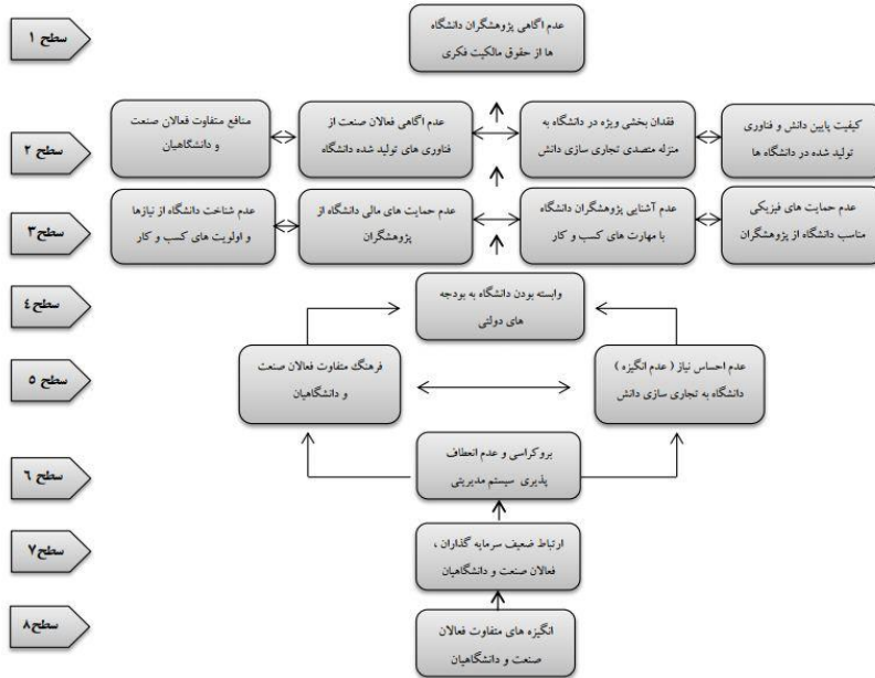
شکل ۲. مدل پژوهش