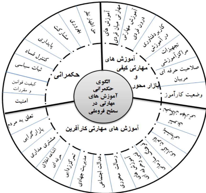
شکل ۲. الگوی استخراج شده حکمرانی آموزش‌های مهارتی در سطح فروملی

کارآموز، صلاحیت حرفه‌ای مربیان، امکانات و تجهیزات مراکز آموزشی، کاربرد فناوری در آموزش، آموزش‌های مهارتی درون‌فردی، آموزش‌های مهارتی میان‌فردی.